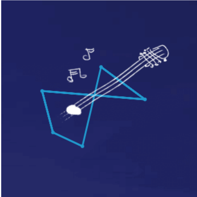
Enea Akademia Talentów

Enea Akademia Talentów to akcja społeczna, w ramach której uruchomiony został program stypendialny skierowany do utalentowanych uczniów szkół podstawowych i gimnazjalnych oraz program grantowy skierowany dla publicznych szkół podstawowych i gimnazjalnych, realizujących autorskie projekty rozwijające talenty i uzdolniania uczniów. Program dotyczył uczniów i szkół z obszaru działania spółek z Grupy Enea: uczniowie rywalizowali o stypendia w wysokości 3000 zł., a szkoły o granty w wysokości 10 000 zł. I edycja akcji trwała od września 2017 r. do stycznia 2018 r. W gronie zwycięzców znalazło się 22 młodych ludzi, 11 ze szkół podstawowych i tyle samo ze szkół gimnazjalnych. W obu kategoriach wiekowych wybrano laureatów w dziedzinie nauka, sztuka i sport. Granty na realizację ciekawych projektów edukacyjnych uzyskało z kolei 9 szkół. Program będzie kontynuowany również w 2018 roku.