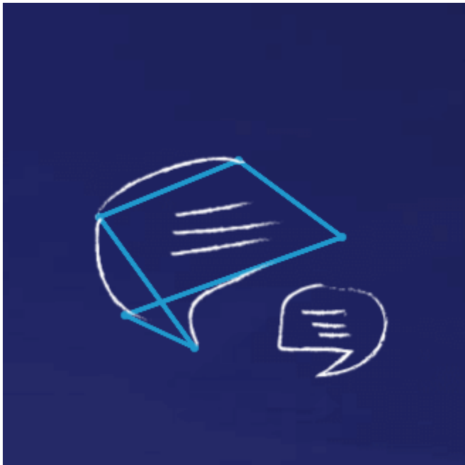
Uruchomienie internetowego chatu dla Klientów Enei

W połowie 2017 roku Enea została partnerem programu Karta Dużej Rodziny, podpisując umowę z Ministerstwem Rodziny, Pracy i Polityki Społecznej. Nowa, dedykowana dla rodzin 3+ oferta Enei to ENERGIA+ Rodzina, która skierowana jest do osób uprawnionych do korzystania z Karty Dużej Rodziny. Posiadanie Karty ułatwia dużym rodzinom dostęp do rekreacji oraz obniża koszty codziennego życia. Rodziny z co najmniej trójką dzieci, dzięki dołączeniu Enei do programu, będą mogły skorzystać ze zniżki na zakup energii elektrycznej.